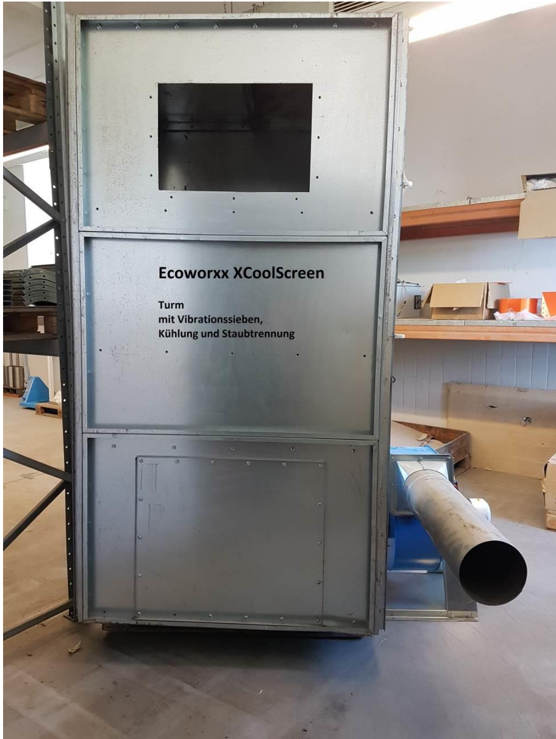
die Abbildung zeigt eine Beispiel-Installation mit Gebläse

Einzel- und Serienfertigung, Sonderprojekte, Vor- und Endmontagen