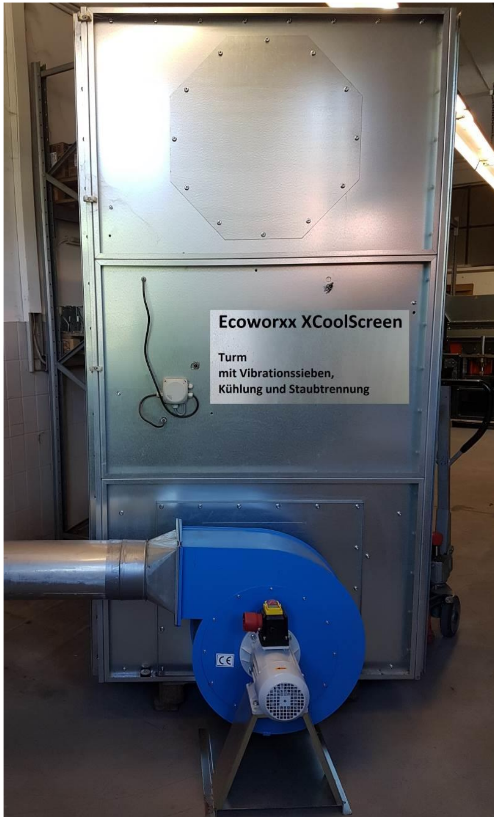
die Abbildung zeigt eine Beispiel-Installation mit Gebläse

Einzel- und Serienfertigung, Sonderprojekte, Vor- und Endmontagen